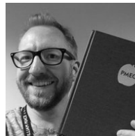
La PMEG estas grava libro por redaktoro

Ĉi-vespere je la 7a horo okazos “interkonatiĝa vespero” en la dua etaĝo de la konstruaĵo Main (#1 sur la mapo). Tio estos okazo por neformale babili kun la aliaj lernantoj kaj la instruistoj.